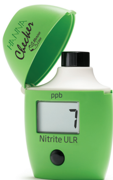
HI764 Nitrito Marino Rango Ultra Bajo

El Checker® HC HI764 de nitrito marino rango ultra bajo es un colorímetro portátil diseñado para medir niveles muy bajos de nitrito en acuarios de agua salada y aplicaciones de biología marina. La nitrificación es un proceso biológico donde el amonio se transforma en nitrito y posteriormente en nitrato mediante bacterias nitrificantes. Debido a que el nitrito puede ser tan perjudicial como el amonio, es importante mantener concentraciones mínimas para proteger la salud de los organismos marinos. El HI764 ofrece una alternativa precisa frente a los kits químicos tradicionales, permitiendo mediciones rápidas y sencillas. Su funcionamiento consiste en realizar el cero, añadir el reactivo e iniciar el temporizador. Su diseño compacto y apagado automático lo hacen ideal para el monitoreo frecuente en acuarios marinos y sistemas biológicos.