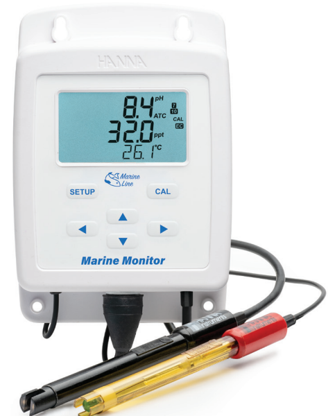
HI981520 Monitor para Acuarios Marinos

El monitoreo continuo de salinidad y pH en acuarios marinos es fundamental para mantener condiciones estables y saludables. El HI981520 es un monitor de montaje vertical diseñado para visualizar pH, salinidad marina y temperatura en acuicultura. La salinidad puede mostrarse en ppt, PSU o gravedad específica, adaptándose a diferentes necesidades. Incorpora pantalla LCD, alarmas configurables para valores extremos, compensación automática de temperatura y una sonda de grafito para mediciones confiables. Además, su electrodo de pH de doble unión ofrece resistencia a la contaminación, proporcionando lecturas rápidas y estables en aplicaciones de monitoreo constante. Su diseño práctico facilita el control del sistema, asegurando un entorno óptimo para el desarrollo de los organismos acuáticos.