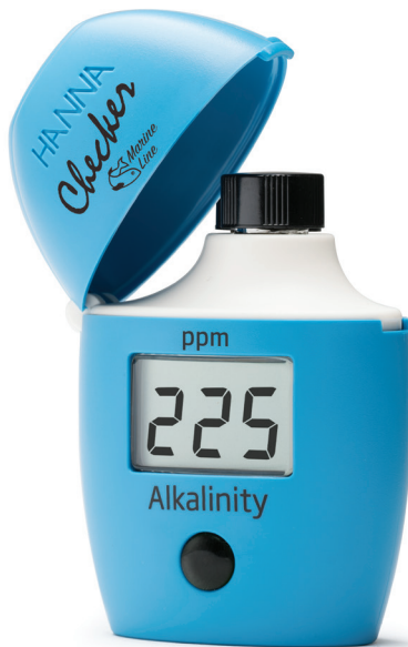
HI755 Alcalinidad Marina de Rango Bajo

El Checker® HC HI755 para Alcalinidad Marina ofrece una forma rápida, precisa y accesible de medir la alcalinidad en acuarios de agua salada dentro de un rango de 0 a 300 ppm de CaCO 3 . A diferencia de los kits químicos de prueba, que dependen de la percepción visual para identificar cambios de color, utiliza un sistema colorimétrico con LED de 610 nm y un foto-detector de silicio para obtener resultados precisos y consistentes. La alcalinidad es un parámetro esencial para mantener un pH estable y proporcionar bicarbonatos necesarios para el crecimiento saludable de los corales. Diseñado como una alternativa más precisa a los métodos químicos tradicionales, el HI755 combina la exactitud de la instrumentación profesional con la practicidad de un equipo portátil, ideal para mediciones rápidas y sencillas en acuarios marinos.