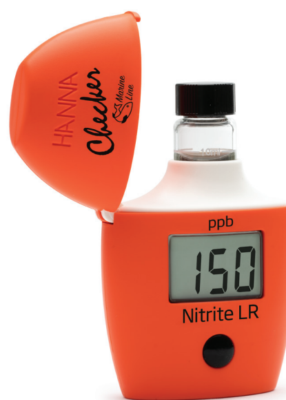
HI767 Nitrito Marino Rango Bajo

El Checker® HC HI767 de nitrito marino rango bajo es un colorímetro portátil desarrollado para la medición de nitrito en acuarios de agua salada y aplicaciones de biología marina. Durante el proceso de nitrificación, las bacterias convierten el amonio en nitrito y posteriormente en nitrato. Cuando los niveles de nitrito aumentan, pueden afectar negativamente la estabilidad y salud de los organismos marinos, por lo que es fundamental mantener un control constante en el sistema. El HI767 combina facilidad de uso, rapidez y precisión en un formato práctico para análisis rutinarios. Para realizar la medición, primero se ajusta el cero, luego se añade el reactivo y el equipo inicia automáticamente el temporizador. Su diseño ergonómico y pantalla LCD permiten un uso cómodo y eficiente en acuarios marinos y monitoreo biológico.