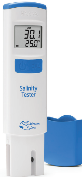
HI98319 Tester de Salinidad para Bajo y Alto Rango

Diseñado para acuarios marinos, acuicultura y aplicaciones de agua salada, este tester portátil de salinidad combina rapidez, precisión y facilidad de uso en un formato compacto e impermeable. Su sonda de grafito ofrece mediciones estables al evitar la oxidación, mientras que el sensor de temperatura expuesto proporciona respuestas rápidas y compensación automática. Permite visualizar resultados en ppt, PSU o gravedad específica, adaptándose a diferentes necesidades de monitoreo. Además, incorpora calibración automática, amplio rango de medición, apagado configurable y hasta 100 horas de uso continuo con batería de litio. Su diseño tipo bolsillo lo convierte en una solución práctica y confiable para mediciones directas en campo o laboratorio, garantizando eficiencia y estabilidad en cada análisis realizado.