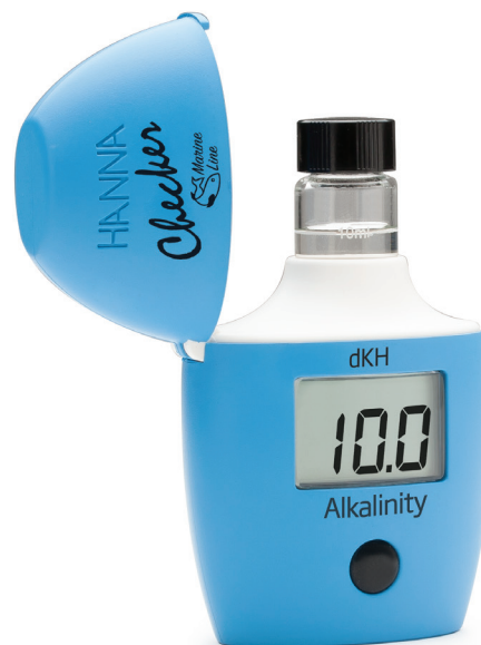
HI772 Alcalinidad Marina en dKH

El Checker® HC HI772 para Alcalinidad Marina está diseñado para medir alcalinidad en acuarios de agua salada de manera rápida y precisa, mostrando los resultados directamente en dKH, una de las unidades más utilizadas en acuariofilia marina. Gracias a su sistema colorimétrico con LED de 610 nm y foto-detector de silicio, ofrece resultados confiables y consistentes sin depender de la interpretación visual de cambios de color. Mantener una alcalinidad adecuada es fundamental para la estabilidad del pH y el crecimiento saludable de los corales. Compacto y fácil de usar, el HI772 brinda la precisión de la instrumentación profesional en un formato portátil ideal para análisis rutinarios.